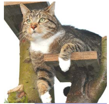
Kater Elvis im Jagdfieber

Phase 5: Ahnungslos kommt Frauchen in die Küche. Doch zu spät. Höchst zufrieden und gesättigt liege ich auf der Couch . . . So liebe ich die Jagd!